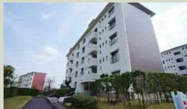
中央台団地218号棟/290万円(仲介)