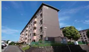
藤山台団地303号棟/210万円(仲介)