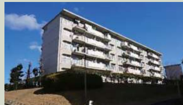
岩成台団地508号棟/360万円(仲介)