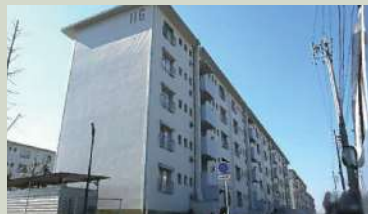
藤山台団地116号棟/190万円(仲介)